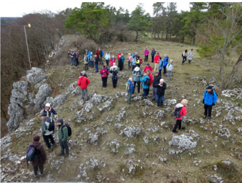
Weiter ging's immer auf dem Plateau entlang Richtung Riedenburg mit schönen Ausblicken ins Altmühltal.