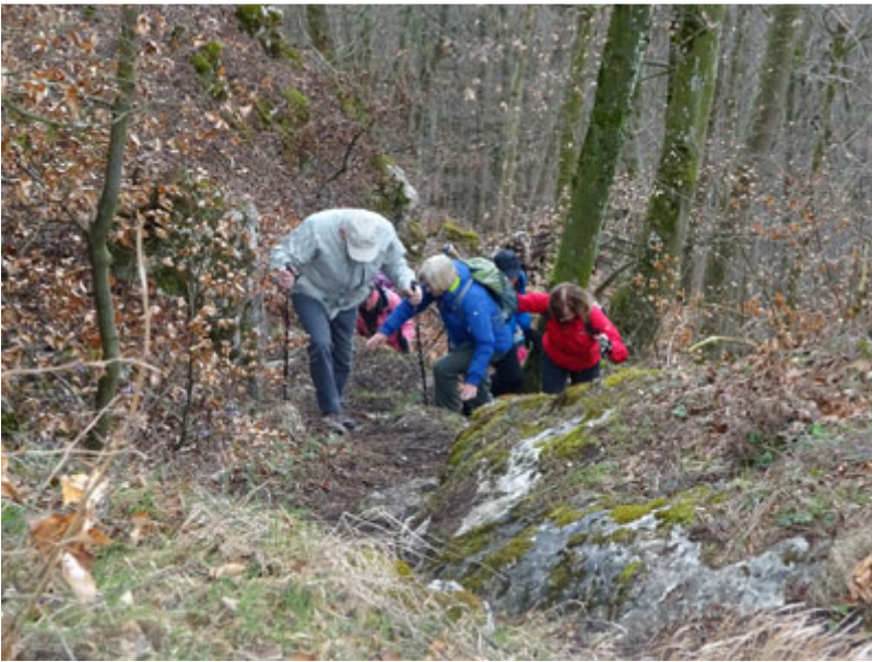
Andere erkletterten die Abflugrampe für die Drachenflieger.